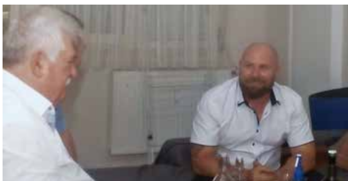
Párom és fiam

1996-ban költöztem Óvárra, próbáltam beilleszkedni. Eleinte nagyon furcsa volt, hogy a panelban még a szomszédok se ismerik egymást. Hamarosan elkezdtem mindenkit köszönteni, pár szót beszélgetni, így megismerkedtünk és jó viszonyba kerültünk. Beléptem a Nők a Városért Egyesületbe, aminek azóta is a tagja vagyok, sőt elnökhelyettese lettem. Maradtam velük annak ellenére, hogy már csaknem 10 éve hazaköltöztem. Kitüntetés is kaptam munkámért. Nemsokára lesz tisztújítás, addig