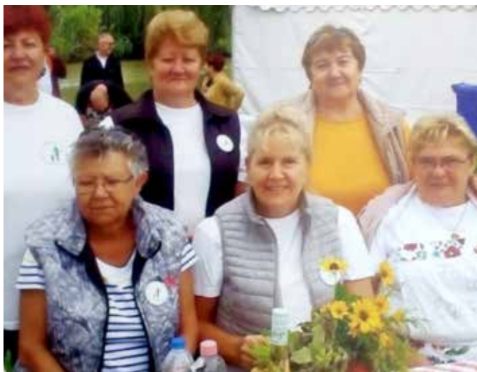
A Nők a Városért Egyesület rendezvényén