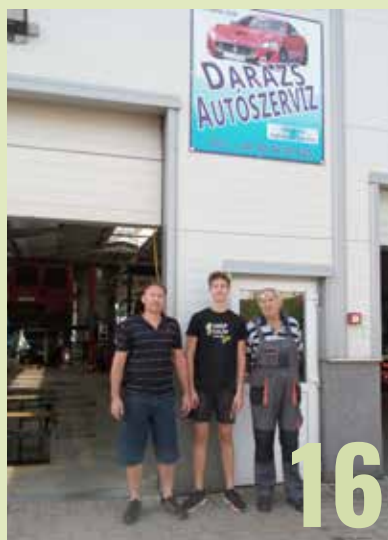
50 éves az autószerelő műhely a Petőfi utcában