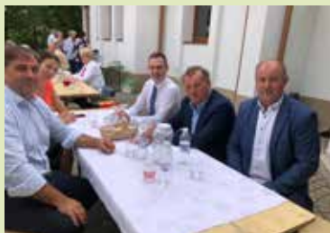
Faluház átadó ünnepség